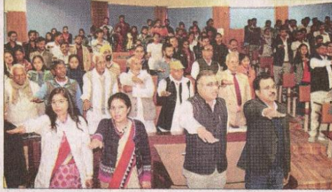
यातायात नियमों का पालन करने की शपथ लेते शिक्षक, ग्रामीण और विद्यार्थी। संवाद

सकती हैं। अगर इसका निर्वाह नहीं किया जाए तो उन्नत, सुसंस्कृत एवं आदर्श