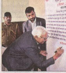
शपथ पत्र पर हस्ताक्षर कर नियमों का पालन करने का संदेश देते वीसी।