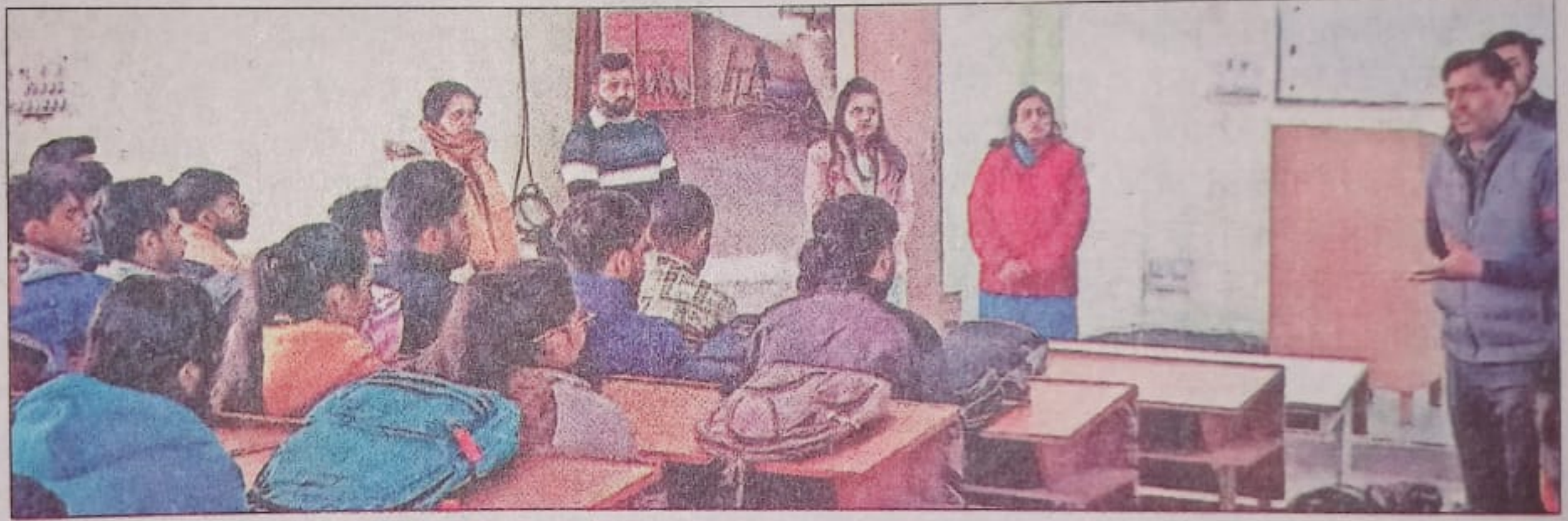
इंदिरा गांधी विश्वविद्यालय, मीरपुर में विद्यार्थियों को संबोधित करते अतिथि।