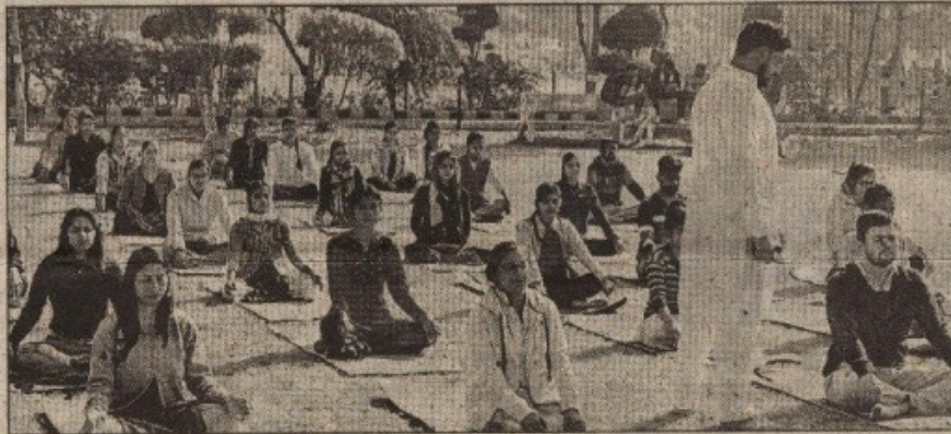
रेवाड़ी। योगाभ्यास करते हुए विद्यार्थी।