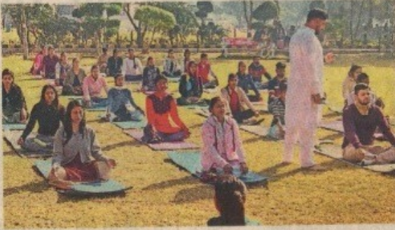
भास्कर न्यूज | रेवाड़ी